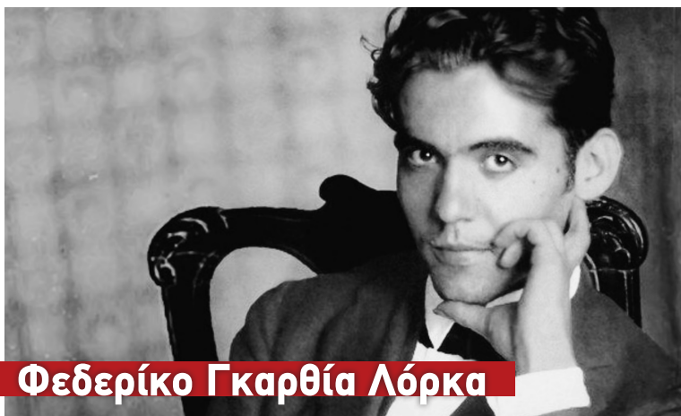
Φεδερικό Γκαρθία Λόρκα

Από το 1954 έως το 1964 έζησε ως πολιτική πρόσφυγας στην ΕΣΣΔ. Το 1964 επιστρέφει με την οικογένειά της (το σύζυγό της θεατρικό συγγραφέα και σκηνοθέτη Γ. Σεβαστίκογλου και τα δυο τους παιδιά) στην Ελλάδα για να ξαναφύγουν πάλι με τον ερχομό της χούντας