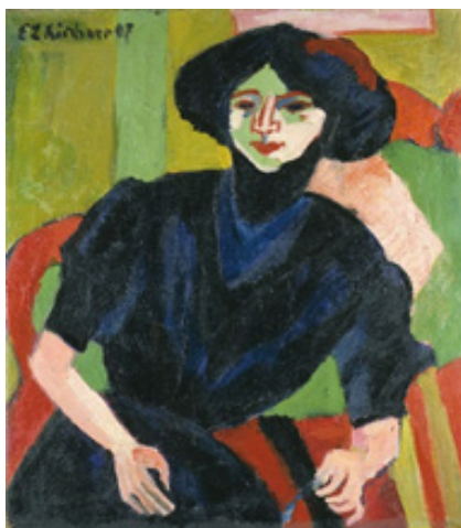
Έρνστ Λούντβιχ Κίρχνερ

Θεωρείται πως οι εξπρεσιονιστές ήρθαν σε επαφή με το έργο των φωβιστών στο Παρίσι. Τα δύο κινήματα διακρίνονται και από ένα κοινό χαρακτηριστικό στην τεχνική τους, συγκεκριμένα τη χρήση έντονων χρωμάτων και αντιθέσεων. Ωστόσο ενώ οι φωβιστές επεδίωκαν με αυτόν τον τρόπο να δημιουργήσουν όμορφες εικόνες, οι εξπρεσιονιστές στόχευαν στην πρόκληση βαθύτερων συναισθημάτων. Για τους Εξπρεσιονιστές, το χρώμα αποτελούσε ένα σημαντικό μέσο έκφρασης από μόνο του, χωρίς απαραίτητα την ανάγκη ενός αντικειμένου. Ο Καντίνσκυ ήταν από τις ηγετικές μορφές του Εξπρεσιονισμού που στήριξαν αυτήν τη θέση και οδήγησαν σταδιακά στη διαμόρφωση της σύγχρονης αφηρημένης τέχνης.