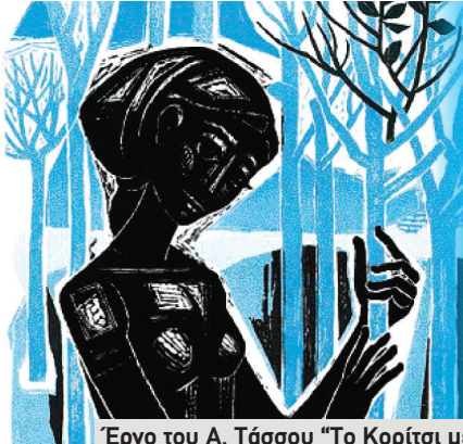
Έργο του Α. Τάσσου "Το Κορίτσι με τα Μικρά Δέντρα" (1963)