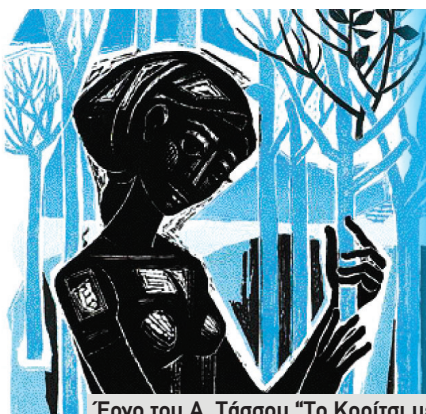
Έργο του Α. Τάσσου "Το Κορίτσι με τα Μικρά Δέντρα" (1963)