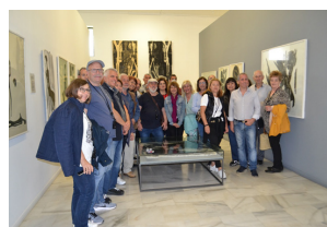
Από την επίσκεψη στο μουσείο

Ώρα προσέλευσης 5:45μμ – Λεάγρου 23 στη Γούβα (στάση Μετρό Άγιος Ιωάννης). Είσοδος ελεύθερη.