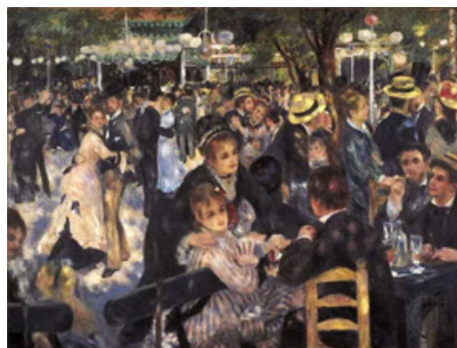
Pierre – Auguste Renoir