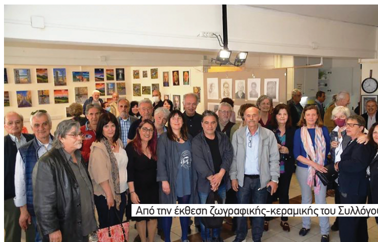
Από την έκθεση ζωγραφικής-κεραμικής του Συλλόγου

Υπεύθυνη Έκδοσης: Αγκαβανάκη Αιμιλία Συντακτική Επιτροπή: Αγκαβανάκη Αιμιλία, Δερέμπεν Διαλεχτή, Νικολάου Δημήτρης, Σταμέλλος Ηλίας, Σώκος Γιάννης, Τσίρκας Πολύβιος