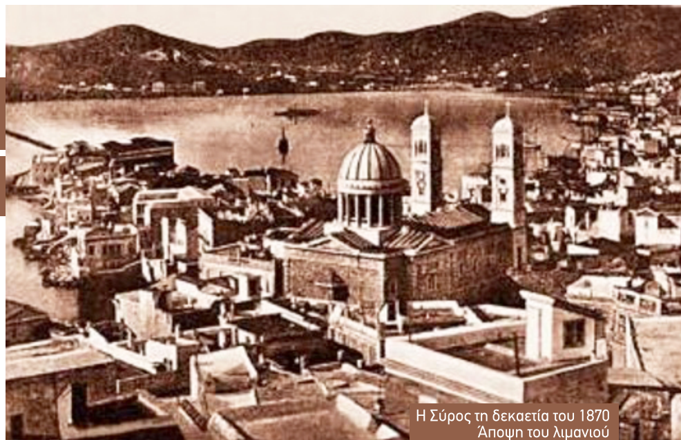
Η Σύρος τη δεκαετία του 1870 Άποψη του λιμανιού

Εκείνη την περίοδο οι συναλλαγές στη Σύρο γίνονταν με ξένα νομίσματα, κυρίως ρωσικά και τουρκικά. Το κράτος και η Εθνική Τράπεζα, στις συναλλαγές τους με τους πολίτες λάμβαναν υπ' όψιν την πραγματική τιμή των νομισμάτων και της δραχμής.